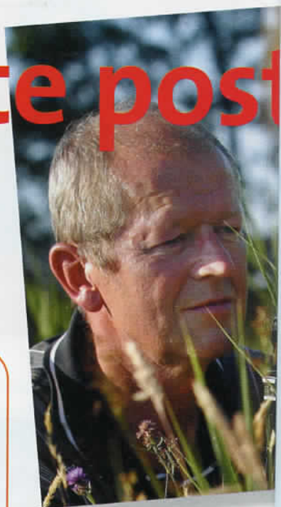
Ruud Knol fotografeerde de dagpauwoog

Na deze succesvolle start gaat TPG Post de Persoonlijke Postzegel in het standaard assortiment opnemen. Jochems: "Er zijn plannen om de twee bestaande series, de Feestelijke en de Bijzondere, uit te breiden met een zakelijke versie. Voor deze variant is met name in het midden- en kleinbedrijf veel belangstelling." En aan het einde van dit jaar heeft TPG Post nog een verrassing: in december zal een speciale uitgifte van de Persoonlijke Postzegel voor de kerst- en nieuwjaarspost uitkomen!