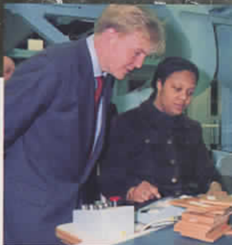
Twee uitersten in beeld. Boven: post sorteren in een rijdend treinrijtuig (circa 1860). Onder: kroonprins Willem Alexander op bezoek bij een ultramodern expeditieknoppunt van het huidige PTT Post.