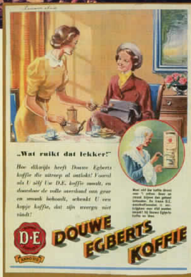
Bedrijfs-Historisch Centrum Douwe Egberts.

Openingstijden: dinsdag t/m vrijdag 10-17 uur, zaterdag t/m maandag 14-17 uur