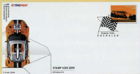
Beursenvelop Rosmalen € 2,27 Bestelnummer 632453

Op 7, 8 en 9 mei is de Nationale Postzegelshow Stamp Kids gehouden in het Autotron Rosmalen. Tijdens deze beurs werd het vijftigjarig bestaan van JeugdFilatelie Nederland gevierd en werd het eerste postzegelvelletje Spyker uitgereikt aan de voorzitter van JFN Kees van Kempen. Spyker is ook het thema van de beursenvelop.