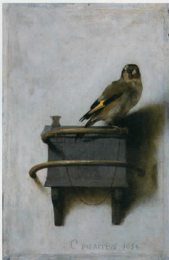
Het Puttertje kenmerkt zich door een lichte achtergrond die bij Rembrandt ondenkbaar is.