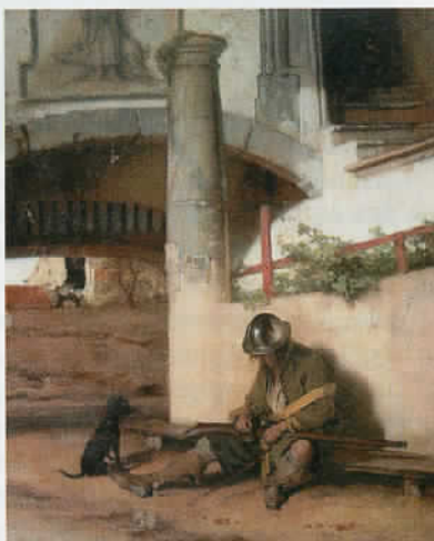
De Schildwacht wordt door zijn ongeëvenaarde helderheid als het meesterwerk van Fabritius gezien.

Bij het publiek is hij minder bekend dan tijdgenoten als Rembrandt en Vermeer, maar kunsthistorici rekenen Carel Fabritius tot de grootsten van de Gouden Eeuw. In het Haagse Mauritshuis komen zijn schilderijen samen op zijn eerste overzichtstentoonstelling.