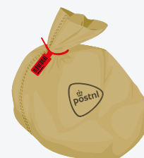
T990526 rode tiwrap