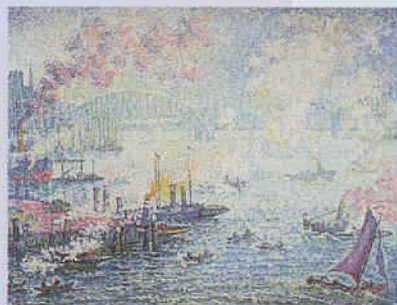
DE HAVEN VAN ROTTERDAM, PAUL SIGNAC. TE ZIEN TIJDENS DE TENTOONSTELLING 'MEESTERLIJK VERZAMELD'.