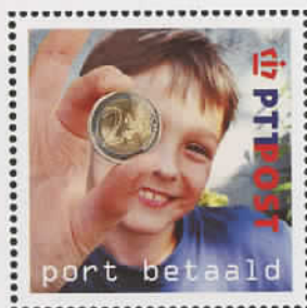
Partijpostzegel Euro Set van vijf stuks f 0,50 / € 0,23 Bestelnummer 216210