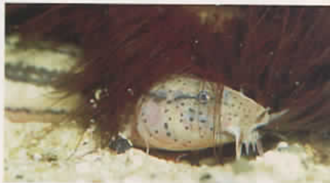
De Grote modderkruiper

werpduo Ewoud Traast & Edith Gruson uit Schiedam en gebaseerd op de oude schoolplaten van M.A. Koekoek. De postzegels hebben een waarde van tachtig cent en zijn uitgebracht in een postzegelboekje met de naam 'Vijf voor de natuur'. Het boekje bevat vijf postzegels en twee sluitzegels, waarop een omschrijving van de beide soorten te lezen is. Het is overigens niet de eerste keer dat PTT Post in samenwerking met Natuurmonumenten een serie uitbrengt: in 1997 werd al een aantal postzegels uitgegeven met als thema 'Natuur en Milieu'.