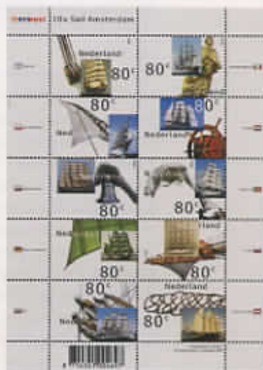
Postzegelvelletje 10x Sail Amsterdam f 8,00. Bestelnummer 200761

Sommige emissies zijn zo gewild, dat ze binnen korte tijd zijn uitverkocht. Dit is bijvoorbeeld het geval met het postzegelvelletje '10x Sail Amsterdam', uitgegeven op 21 augustus jl. Het is inmiddels niet meer verkrijgbaar op de postkantoren en wordt ook niet herdrukt. Heeft u het velletje nog niet in uw bezit? Maakt u zich geen zorgen. De Collect Club heeft uiteraard voldoende postzegelvelletjes gereserveerd voor haar abonnees op de Jaarcollectie Postzegels 2000. Verder zijn ook nog enkele exemplaren beschikbaar voor de losse verkoop. Wilt u het postzegelvelletje nog bemachtigen, wacht dan zeker niet te lang met bestellen!