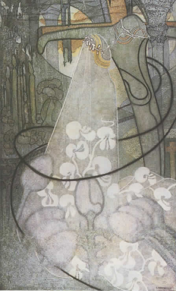
Afbeelding links: 'O grave, where is thy victory' van Jan Toorop.

Grote foto: kunsthistoricus Tejo Meedendorp voor een glas-in-loodraam in de Beurs van Berlage, een karakteristiek voorbeeld van Nederlandse kunst rond 1900.